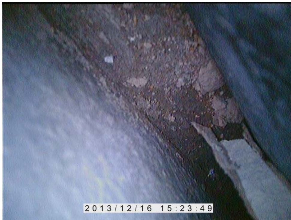
Bild mit Inspektionskamera auf Verklebung Rigips